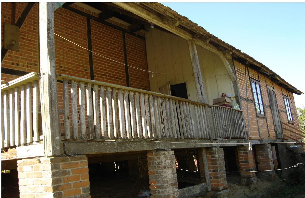
FOTO DA FACHADA DOS FUNDOS