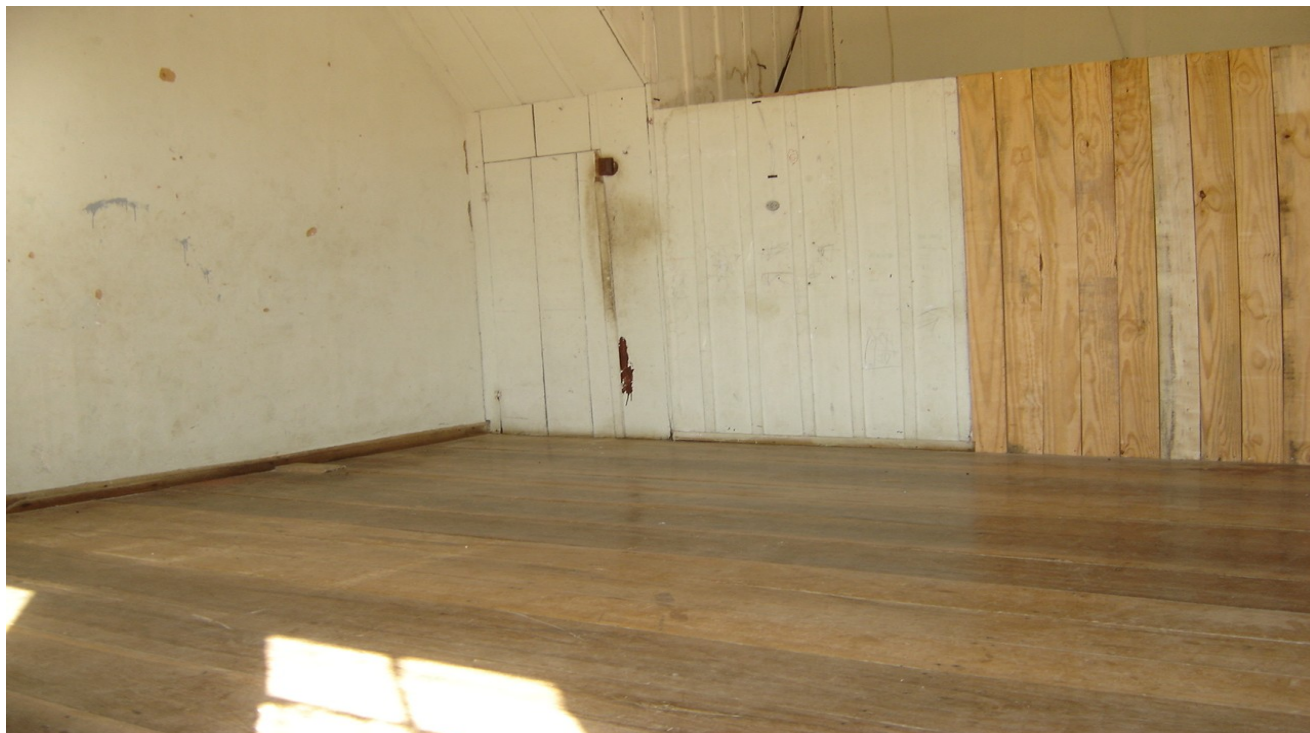
FOTO DAS DIVISÓRIAS FEITAS SOBRE O PISO EXISTENTE