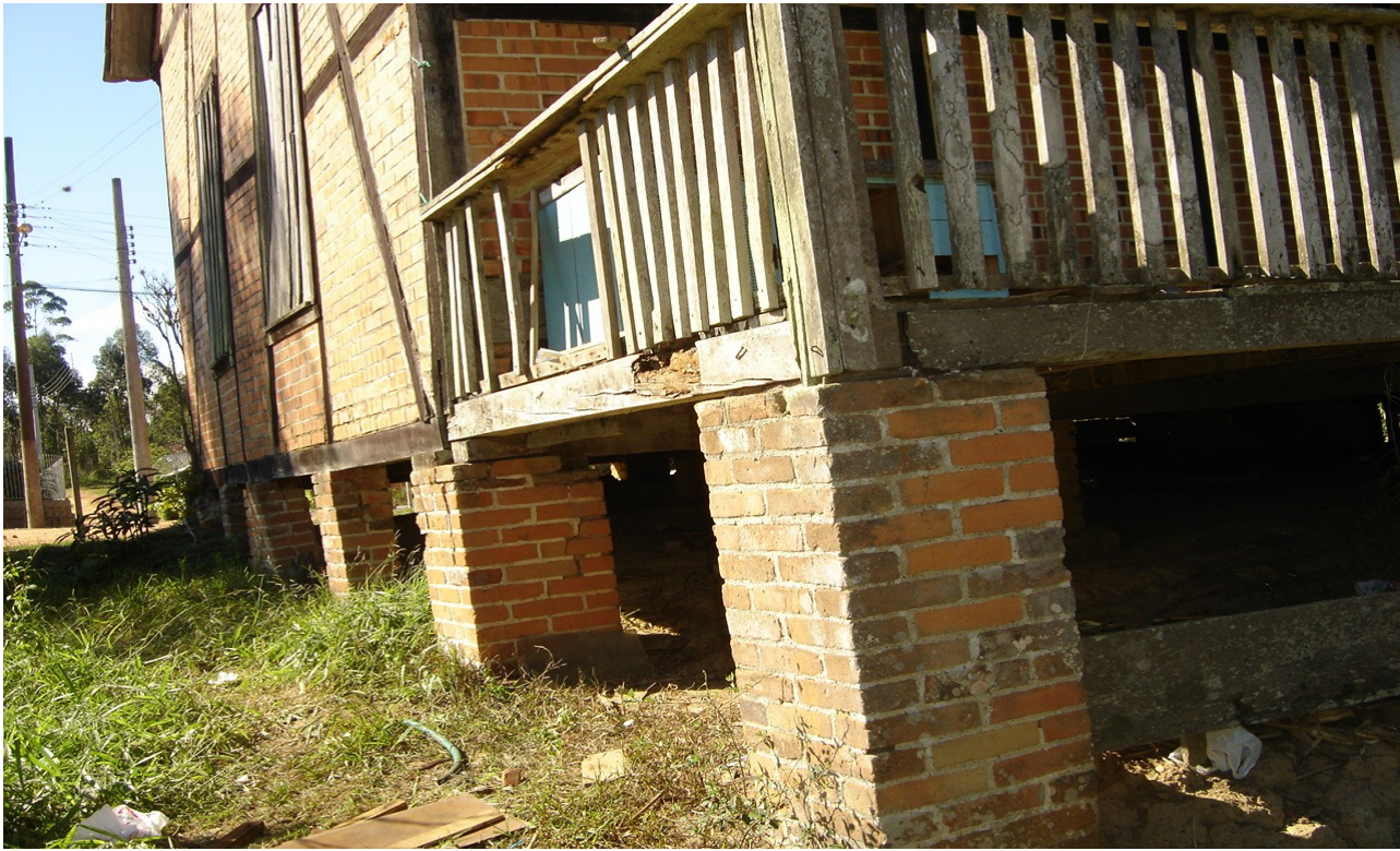
DETALHE DA ESTRUTURA DA CASA